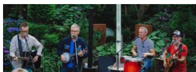
Beers for Tears